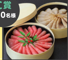
銀閣寺大西 銀の華 ローストビーフ・ 焼豚銀閣2種