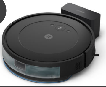
iRobot ロボット掃除機 ルンバ コンボエッセンシャルロボット