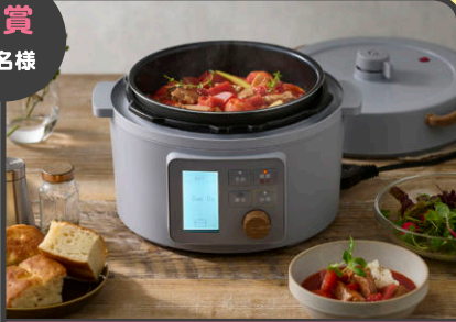
アイリスオーヤマ 電気圧力鍋 3.0L