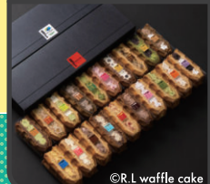
R.L. waffle cake ワッフルケーキ 20種セット